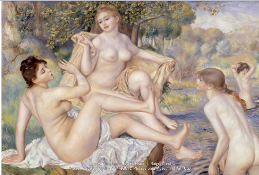
Las grandes bañistas (Les Grandes Baigneuses) Pierre-Auguste Renoir (1884-1887). Philadelphia Museum of Art, USA