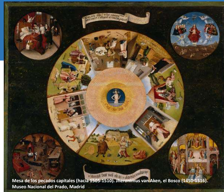
Mesa de los pecados capitales (hacia 1505-1510). Hieronymus van Aken, el Bosco (1450-1516). Museo Nacional del Prado, Madrid